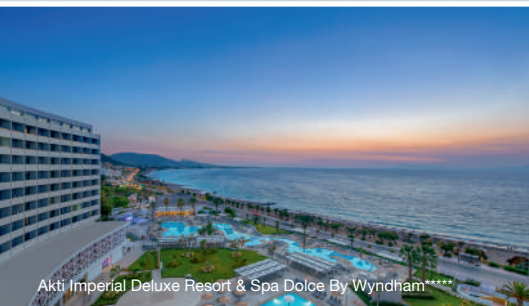
Akti Imperial Deluxe Resort & Spa Dolce By Wyndham*****

Wunderschöne Frühjahresflugreise mit dem ASGB Südtirol